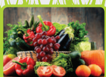
344-06 Fruits et légumes