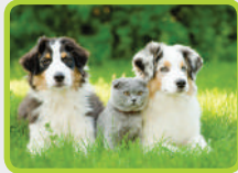
344-03 Chien & Chat